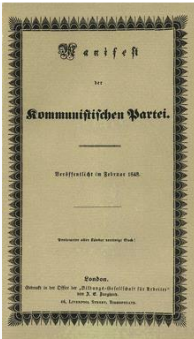
«Манифест коммунистической партии» — оригинал

Впоследствии В. И. Ленин , споря с ревизионистами марксизма, такими как Бернштейн , доказывал, что завоевание власти мирным путём — лишь один из способов, применимый далеко не всегда, при этом Ленин апеллировал к работам основоположников марксизма: во многом этому была посвящена одна из самых знаменитых работ Владимира Ильича « Государство и революция », изданная в 1918 году (написана в 17-м) (23). Ленин настаивал на том, что социализм нельзя «ввести», что путь к нему лежит через ожесточённую борьбу, а между капитализмом и социализмом следует длительный период применения насилия, которому соответствует диктатура пролетариата (24) — первая форма принуждения не эксплуататоров трудящихся (рабовладельцев-феодалов-капиталистов, как было в предыдущие общественные формации), а самих трудящихся. Формой осуществления этой власти являются советы (25).