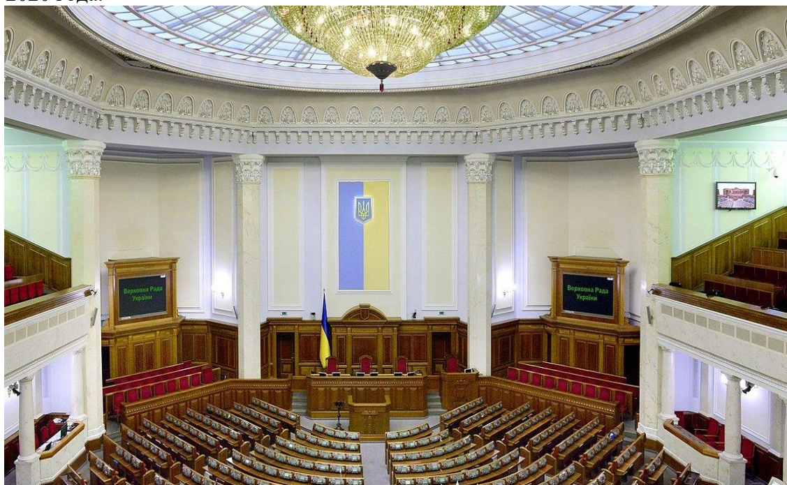
Савченко предрекла Украине исчезновение с карты мира

Напомним, в середине ноября парламент Украины в первом чтении принял законопроект , предусматривающий отмену моратория на продажу земель сельскохозяйственного назначения. Для окончательного утверждения документа депутаты проведут еще одно чтение. Отменить запрет на продажу сельхозземель планируют с 1 октября 2020 года.