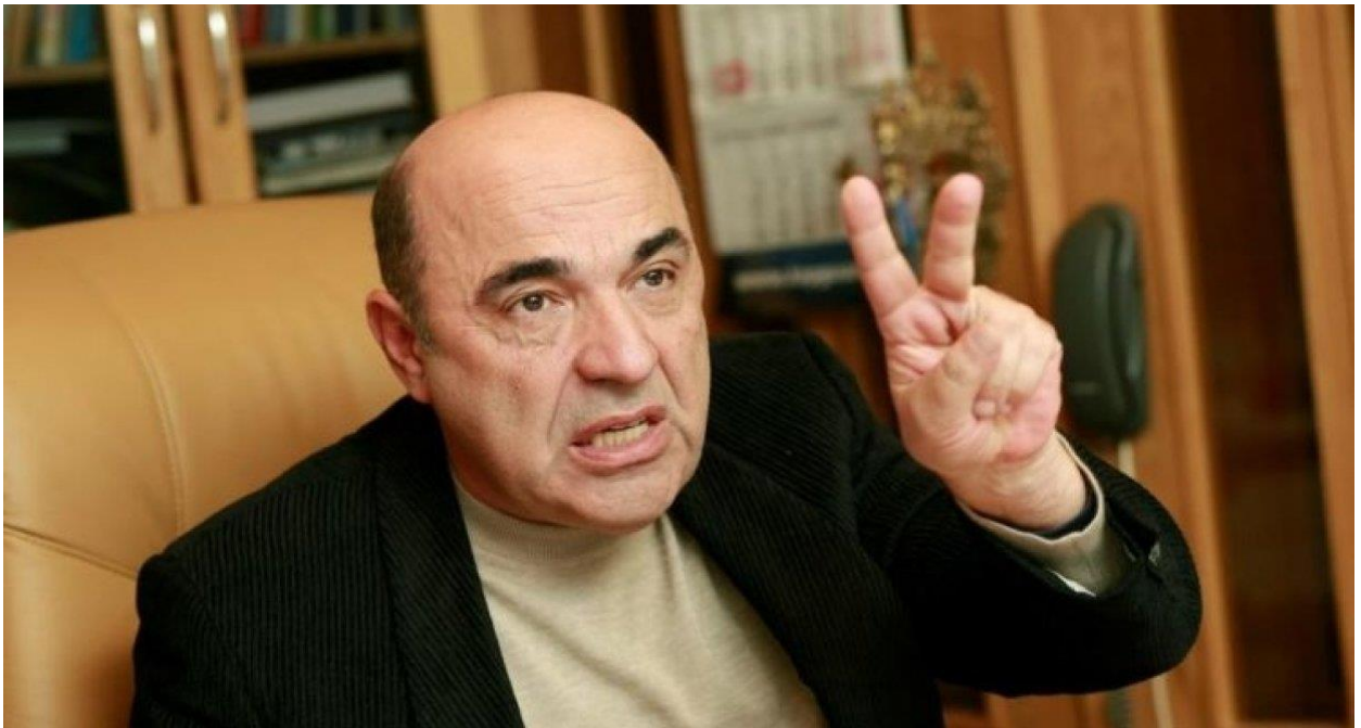
Президент Зеленский запустил процедуру распродажи Украины — политолог

«Нами управляют те, кому Украина, в общем, не нужна. Которые приехали сюда на заработки, приехали сорвать куш и потом у себя в кабаках рассказывать после принятой марихуаны, как обдурили Украину. Так нельзя. Владимир Александрович (Зеленский. — Прим. ФАН), вы обещали нам другое. Где это все?», — задается вопросом Рабинович.